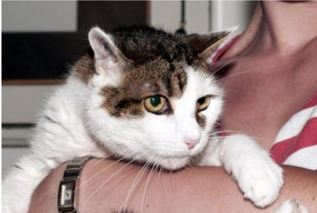
Der 13-jährige Kater Paulchen hofft auf ein Zuhause!