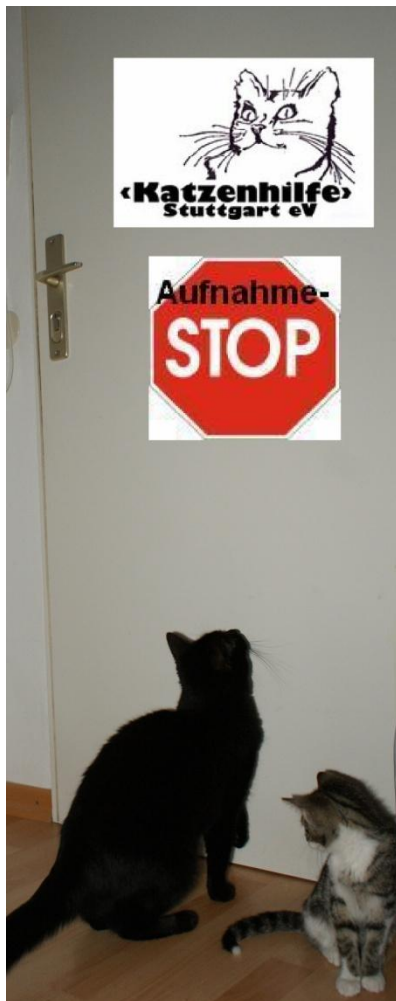
Die Tür bleibt zu: Aufnahmestopp bei der Katzenhilfe Stuttgart

KATZENHILFE STUTTGART eV Sormaweg 5 70563 Stuttgart