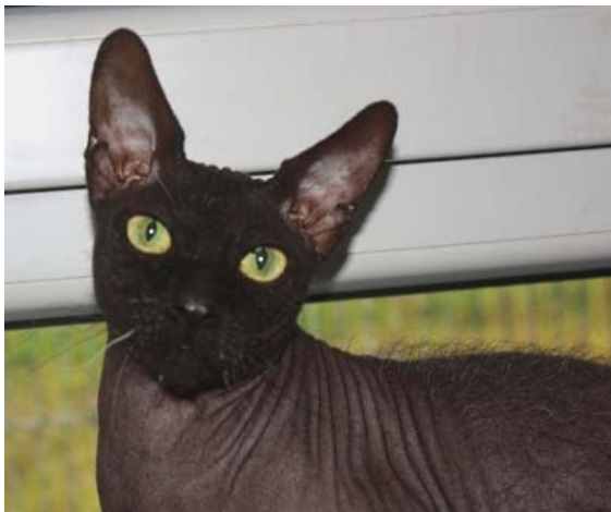
einsam und allein Sphynx Kater Frodo

Spendenkonto BW Bank Stuttgart ( BLZ 60050101 ) Konto 2819598