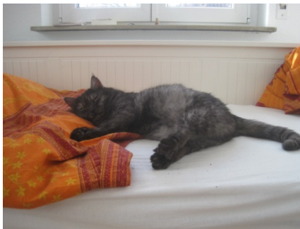
Die „Süßen“ Mimi (l.) und Gartie (r.) haben ein liebevolles Zuhause verdient