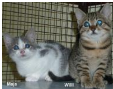
Wo dürfen Maja & Willi einziehen?