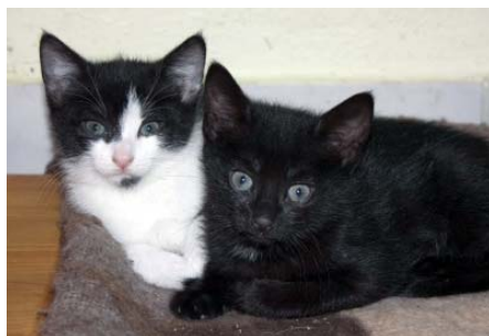
Betty & Babsy hoffen auf ein Plätzchen