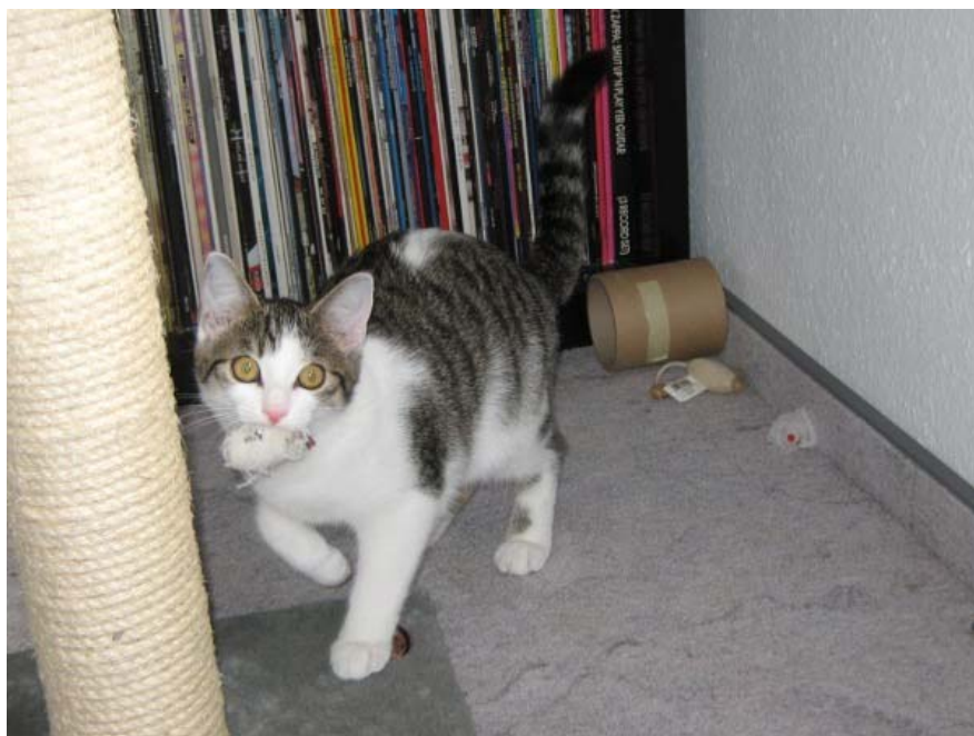
Claudia Kaisers aktueller Gast Speedy (fast 1,5 Jahre) und ihre Maus suchen demnächst ein Zuhause.