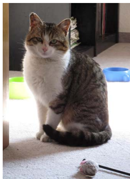
Joey sucht jetzt ein Zuhause statt Bräute

BW Bank Stuttgart (BLZ 60050101) Konto 2819598